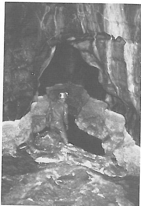
Siphon amont du Parc des Princes, déboué et en voie d'assèchement suite à la crue

PESTERA TAUSOARE (Rodnei) 461,6 m (-356, +105,6). SURĂ MARE (Sebes) +405 m. AVENUL DIN STANUL FONCII (Padurea Craiului) -339 m. PESTERA DE LA JGHIABUL LUI ZALION (Rodnei) 303 m (-298,5, +4,5) PONORUL SINCUTA (Padurea Craiului) -295 m. AVENUL DIN HOANCA URZICARULUI (Bihor) 288 m (-286, +2). PONORUL RACHITEANA (Sebes) 287,5 m (-282,5, +5). AVENUL DIN DOSUL LACSORULUI (Sebes) -268 m. AVENUL DIN POIANA GROPII (Domanului) -236 m. AVENUL DIN DEALUL SECATURA (Bihor) -230 m.