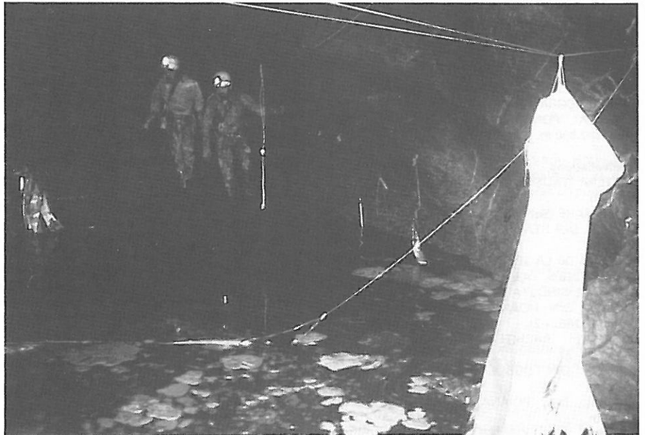
Bivouac - 700 balayé entièrement par la vague de crue - cliché Luc Funcken (Siebenhengste).

Nous avons pu observer récemment, dans le Laboratoire Souterrain de Moulis, deux protées